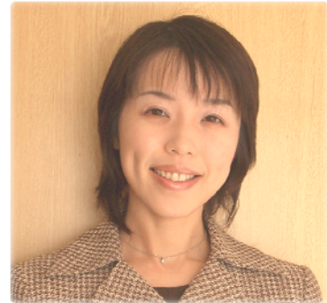
フリーアナウンサー 日本話しことば協会認定講師 日本交流分析協会認定インストラクター

元FM愛媛アナウンサー。現在はフリーで、司会、講師の仕事を中心に活動中です。話すこと、聴くことの嬉しさ、大切さ、コミュニケーションの喜びを、「おはなし会」や「こえ浴教室」など独自の講座を通して、楽しく伝えています。