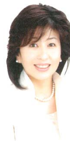
愛媛学園 事業部部長 愛媛コミュニケーション ビジネス専門学校教員

お客様のニーズが多様化している現代においては、お客様一人ひとりの価値観を受け入れ、サービス提供者が人としてどう対応するかが大切。受講者のこころの成長に繋がる研修を心がけています。